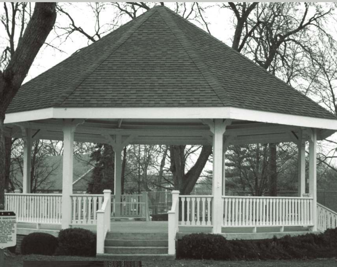
Podium dla orkiestry im. Dennisona Wheelocka, zrekonstruowane w latach 1979-1980, Carlisle, Pensylwania