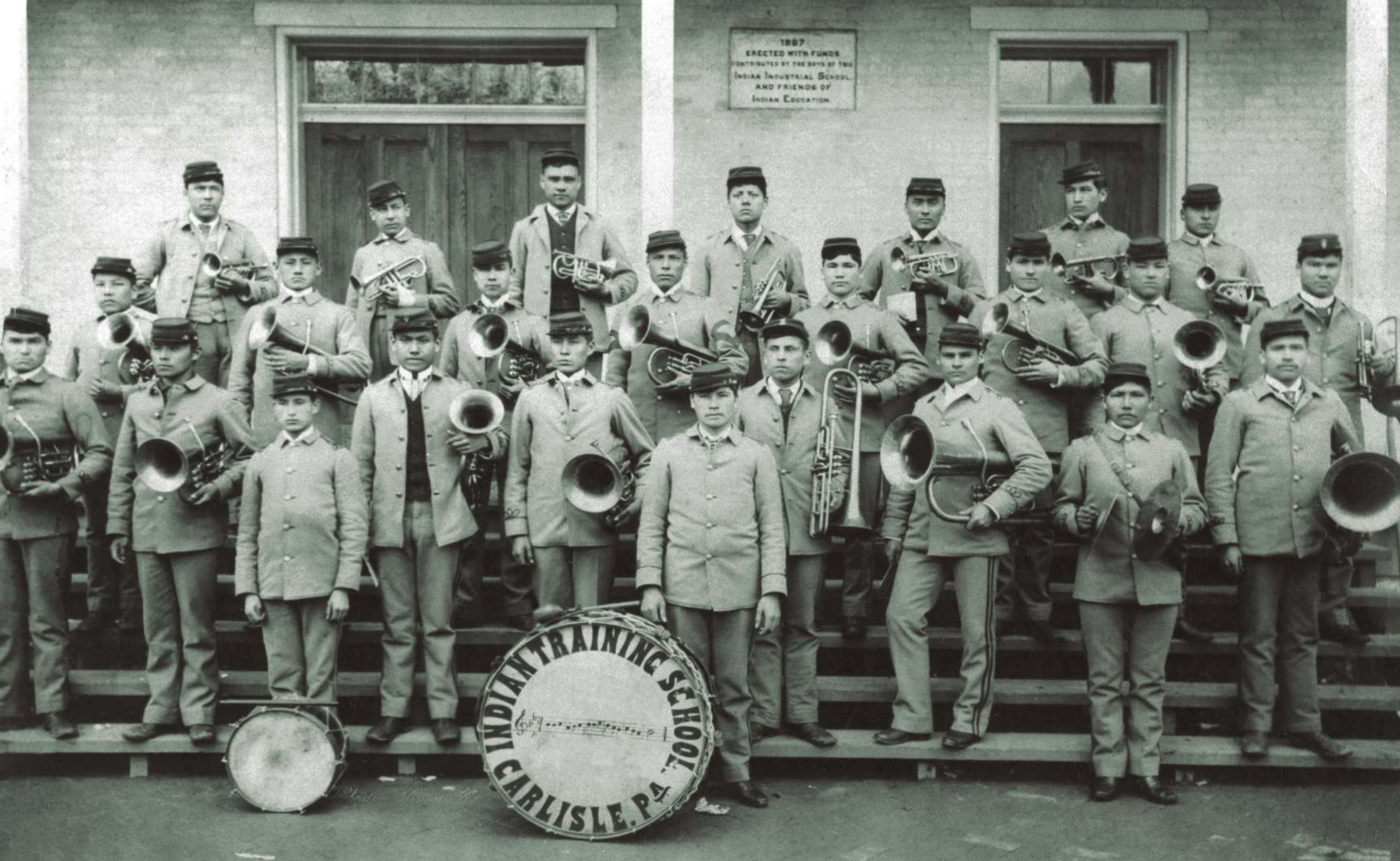
Orkiestra indiańska z Carlisle, ok. 1887 roku. „Gdybyście mogli to usłyszeć! To było okropne! Ale my myśleliśmy, że sprawiliśmy się nieźle” – pisał o jej początkach Luther Standing Bear